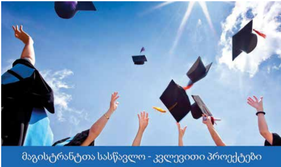
მაგისტრანტთა სასწავლო - კვლევითი პროექტები

„პროექტის გამარჯვება, ჩემი აზრით, უპირველესად თავად თემამიკამ განაპირობა. ეს საკითხი ქართულ არქეოლოგიაში დღემდე არ არის შესწავლილი სრულად და ასეთი მნიშვნელოვანი მასალებისთვის თითქმის არ არსებობს კონკრეტული და კრებითი სახის ნაშრომი. ვფიქრობ, რომ აღნიშნულ კონკურსში უპირატესობა მიენიჭა ისეთ